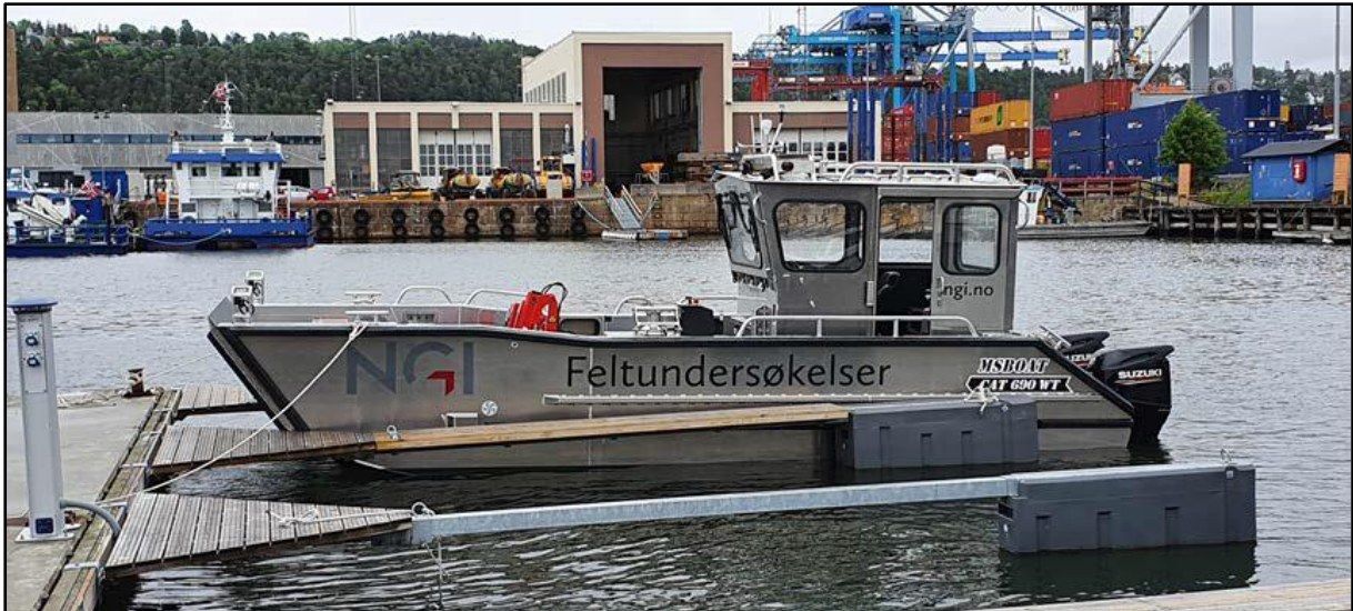
Figur 1. NGIs feltbåt F/F Kolstad. Båten er spesialutrustet for sedimentprøvetaking med grabb.

HMS på feltdagen: Ved opphold på både båten og på brygga skal det brukes redningsvest. Ved arbeid med kran om bord i F/F Kolstad er det også påbudt med hjelm og verneøvler. Redningsvest og hjelm medbringes av den enkelte, og de som ønsker å delta aktivt i opplegget knyttet til grabb- og kjerneprøvetaking må også ha med egne godkjente verneøvler. Hver deltaker må stille med egnede arbeidsklær og hansker tilpasset værforholdene. Tynne engangshansker vil være tilgjengelig.