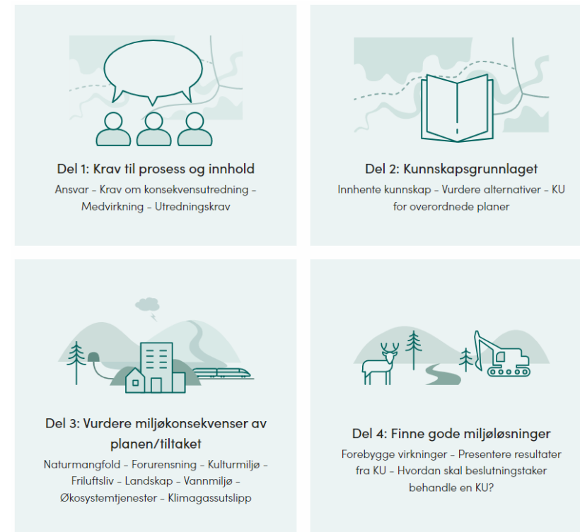
Figur fra M-1941