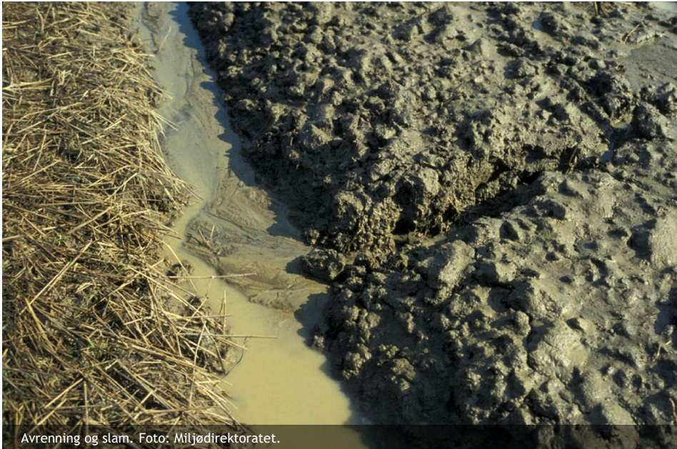
Avrenning og slam.