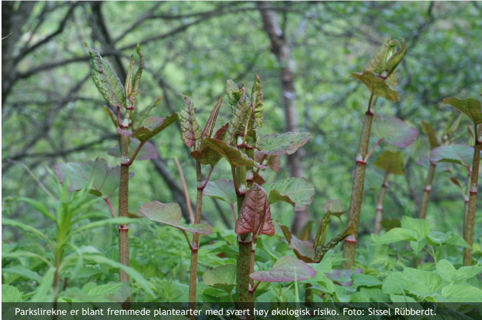
Parkstirekne er blant fremmede plantearter med svært høy økologisk risiko.