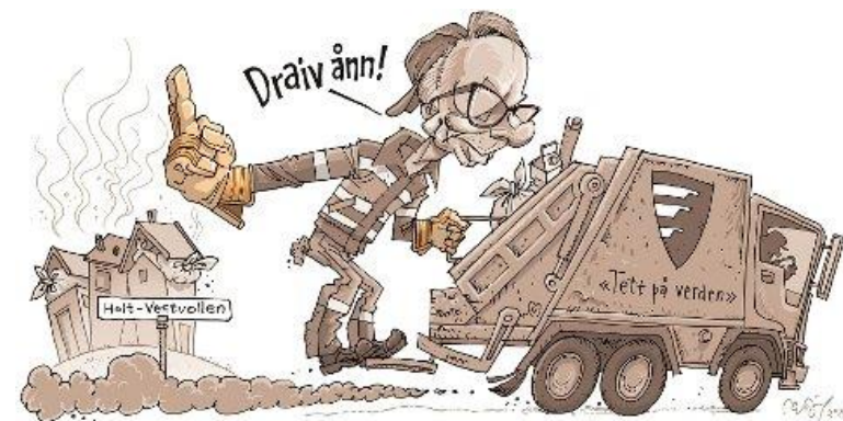
Illustrasjon: Romerikes blad