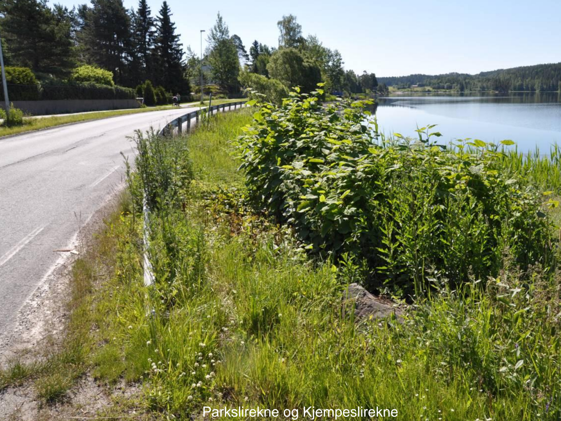
Parkslirekne og Kjempeslirekne